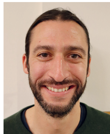
Prof. Nicolas Langer

Per misurare le abitudini di mobilità possiamo ricorrere a una grande varietà di tecnologie, che rilevano aspetti diversi della mobilità. Smartphone e smartwatch sono per esempio dotati di sensori come GPS, accelerometri e giroscopi (giroscopi simmetrici) e offrono molteplici possibilità di monitorare i nostri movimenti, l'ubicazione e l'attività fisica. Sono in grado di contare i passi, di misurare le distanze percorse e riconoscere il tipo di movimento (p. es. camminare, correre, andare in bicicletta). Dal canto loro, i tracciatori GPS indicano con precisione l'ubicazione e i modelli di movimento di una persona e sono particolarmente utili per analizzare i profili di movimento nello spazio e la frequenza delle visite a determinati luoghi. I sensori installati nelle abitazioni, come quelli di movimento, forniscono indicazioni sui modelli di movimento all'interno della casa. È pure possibile integrare sensori nelle scarpe per studiare il movimento e la camminata di un individuo. Ognuna di queste tecnologie ha i suoi specifici punti forti e deboli, ed è possibile sceglierla in funzione delle necessità e dei contesti. Nel nostro studio facciamo uso di una combinazione di queste tecnologie nell'intento di tracciare un quadro completo delle abitudini di mobilità di una determinata persona.