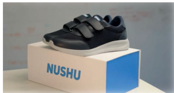
Scarpe con sensori

Il suo progetto mira a diagnosticare le patologie demenziali già in uno stadio precoce. Perché la diagnosi precoce è così importante?