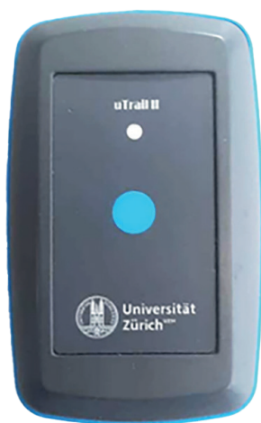
Tracker di attività

indicazioni di un'Alzheimer presintomatica. Ecco perché i biomarcatori digitali presentano un grande potenziale in ambito diagnostico.